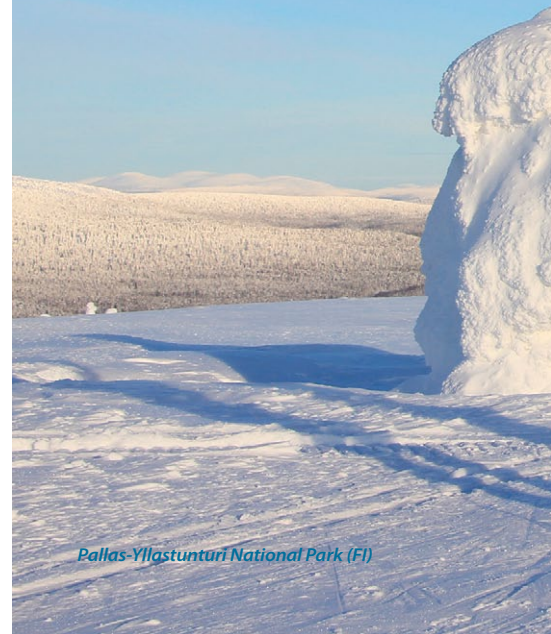
Pallas-Yllastunturi National Park (FI)

«Il Turismo Sostenibile nelle aree protette europee fornisce una esperienza significativa di qualità, salvaguarda i valori naturali e culturali, sostiene l'economia e la qualità della vita locale ed è economicamente realizzabile».